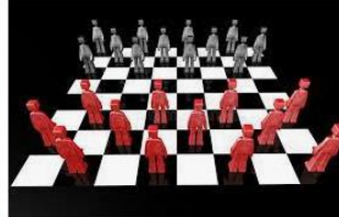
Concepto Del Juego De Mesa Del Inspector Sto...