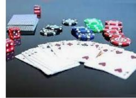
Qué son los Juegos de Mesa? » Su Defini... conceptdefinicion.de