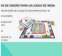
de Diseño de un juego de Mesa are.net