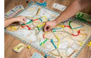
> Tipos de juegos de mesa: qué tipos existen ... juegosdemesayrol.com