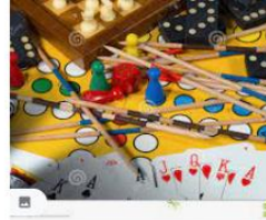
Concepto De Los Juegos De Mesa F... es.dreamstime.com